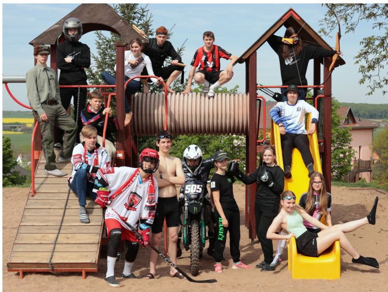
Loučí se letošní devátáci!

OBEC LIBČANY A KLUB RODIČŮ A PŘÁTEL ŠKOLY VÁS SRDEČNĚ ZVE NA (PŘELOŽENÝ) DĚTSKÝ DEN: