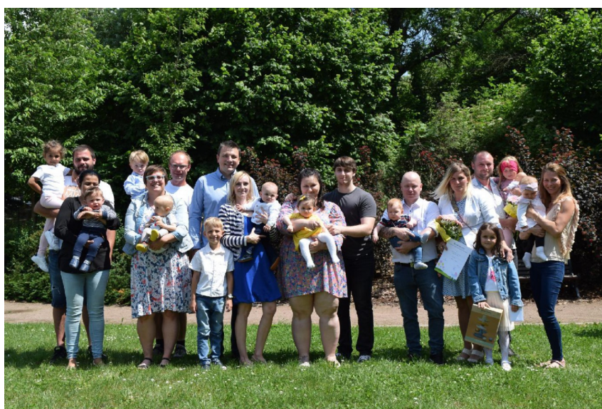
Fotografie z "Vítání občánků", neděle 2.6.2024, v Továrním parku.